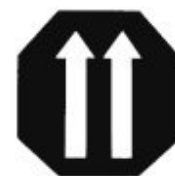
Emblème fin 1943