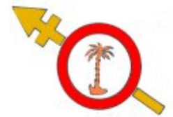
Emblème début 1943

Le 754 ème Régiment d'infanterie est alors composé de 3 bataillons avec chacun 3 compagnies d'infanterie (chacune incluant 12 LMG et 2 mortiers de 80mm), 1 compagnie d'artillerie (incluant 2 canons 150mm sIG et 4 canons 75mm IeFH) et 1 compagnie d'antichar (incluant 3 canons 75mm Pak 40, 6 canons 50mm Pak 38 et 3 LMG).